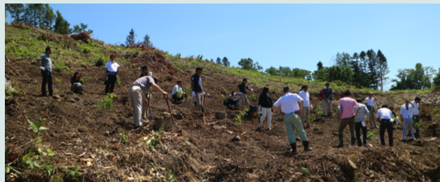
北海道美幌町 植林風景

2019年8月より北海道美幌町にて「あいおいニッセイ同和損保の森」植林活動に取り組んでいます。植林地の土壌の特徴に合わせ、水気に強い3種類の広葉樹（ミズナラ・シラカバ・ヤチダモ）を3年間で12haの土地に植樹をしました。美幌町では森林の環境保全に配慮した木材の認証制度であるFSC認証に力をいれています。当社は、森林を守り育てる活動に積極的に取り組んでいます。